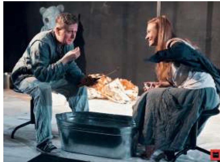
Театральный фестиваль открыл внеконкурсный спектакль «Чайка» в постановке режиссёра из Санкт-Петербурга